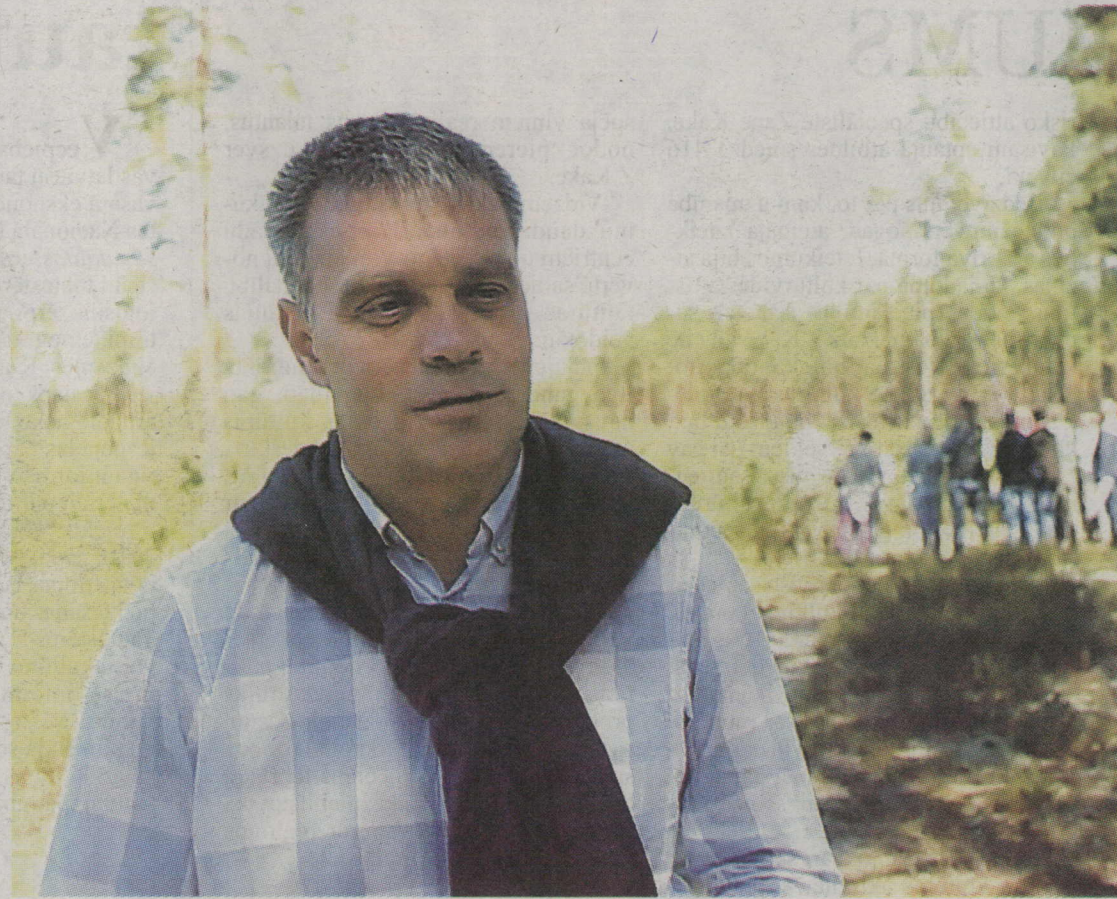
◆ GRIGORIJS ROZENTĀLS.